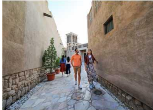
Пішохідна екскурсія старовинними районами Дубаю