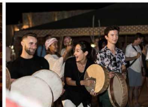
Прибуття в справжній бедуїнський табір, сповнений традиційними розвагами