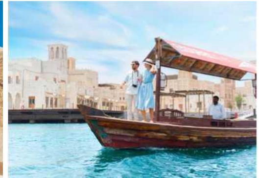
Традиційна поїздка на Абре (водне таксі), що перетинає Дубайську затоку.