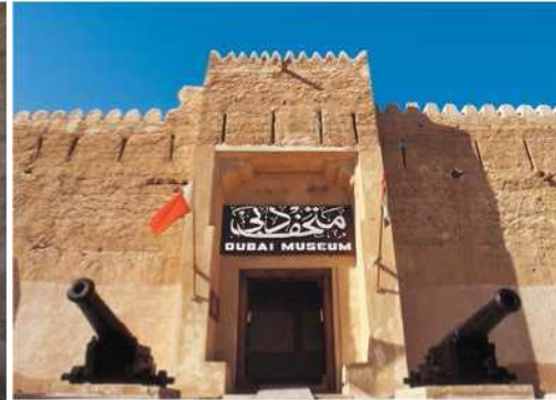
Відвідування Дубайського музею